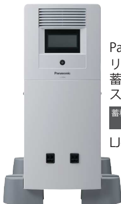
Panasonic リチウムイオン 蓄電システム スタンドアロンタイプ