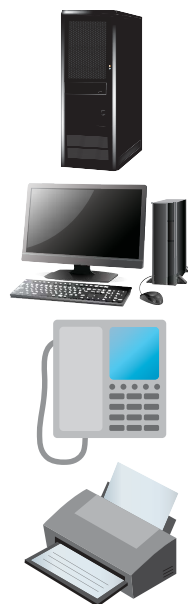
パソコン、サーバー、 通信設備など