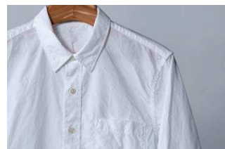
シワがつきやすい綿100%でも、シワが少ない仕上がりに。