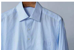
綿35%・ポリエステル65%のシャツでシワが軽減。

標準コースの運転でも大風量で一気に乾かすことで自然とシワが伸び、アイロン掛けの手間が省けます。